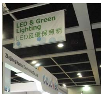
3b. Overhead hanging banner above booths