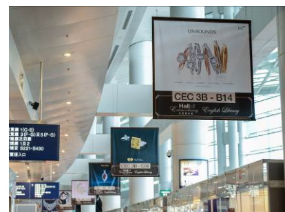
3a. Overhead hanging banner along Hall 1 concourse