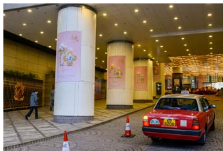
3c. 港湾道入口圆柱式横幅广告