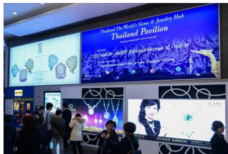
2. 港灣道入口燈箱廣告