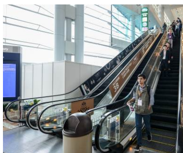
1. Escalator ad

* available for Hong Kong exhibitors only