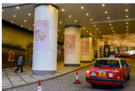
3c. Pillar banner at Harbour Road entrance