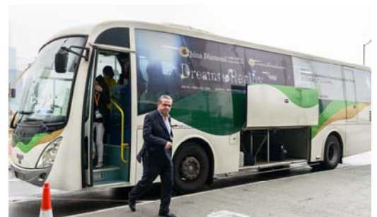
4. 大会穿梭巴士车身贴纸广告