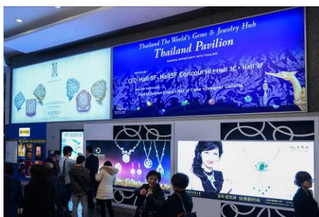
2. Lightbox at Harbour Road entrance