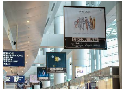
3a. 展馆一大堂的横幅广告