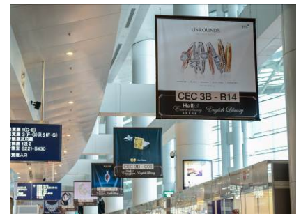
3a. 展館一大堂的橫幅廣告