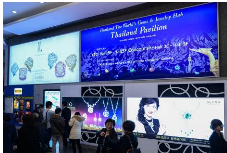
2. 港湾道入口灯箱广告