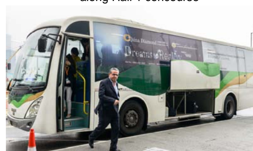
4. Shuttle bus sticker ad