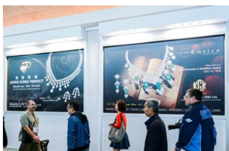
5. Hanging poster