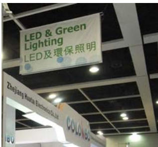
3b. 參展商展台上方的橫幅廣告